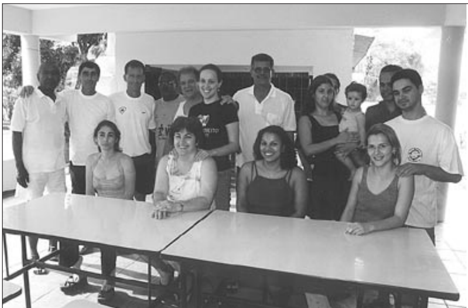
Pelo 4º ano consecutivo, ex-atletas se encontram para relembrar os velhos tempos

Paraná disse que o objetivo principal do encontro é promover a confraternização dos ex-craques. Segundo ele, desde 1997 o evento vem sendo realizado. No primeiro ano foi em Mogi Guaçu, no segundo em Caraguatuba, o terceiro em Ribeirão Preto e agora em Sorocaba. "Domingo (amanhã) nós